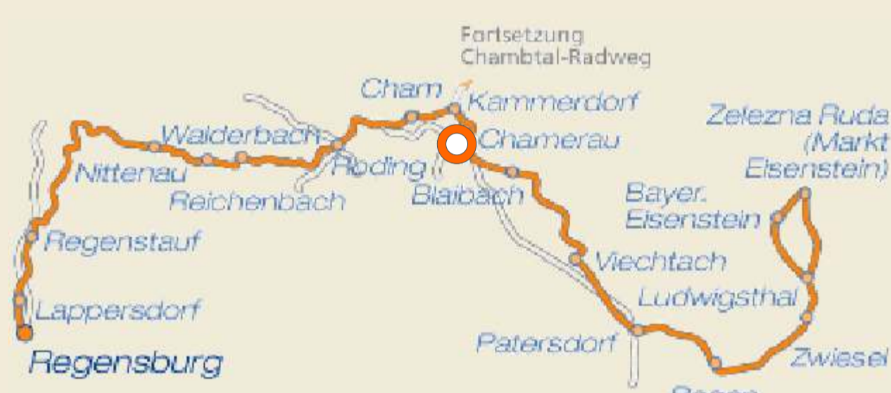
Regentalradweg Karte bei uns erhältlich